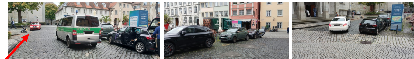
(Der rote PKW musste anhalten)

An dieser Stelle ereignen sich dauerhafte Konflikte zwischen dem Lieferverkehr für die anliegende Gastronomie, dem Autoverkehr sowohl in Richtung Schmiedgasse als auch zwischen dem Marktplatz und dem Stiftplatz (in beiden Richtungen), dem Fahrradverkehr (auch in beiden Richtungen) und dem Fußverkehr.