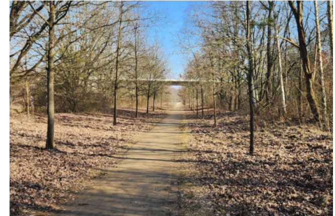
Der ehemalige Güterbahnaußenring mit dem Adolf-Kiepert-Steg