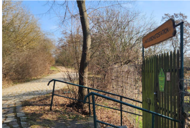
Unterwegs treffen wir auf die Naturschutzstation, aber auch das Umweltbundesamt