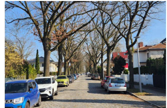
Eichenbestand in der Grimmstraße

Die Grünen Hauptwege erhalten Zug um Zug eine neue Ausschilderung. Kennzeichen ist ein weißer "Wanderbär" auf grünem Grund. Noch ist der Weg 15 mit weiß-blau-weißen Streifen und weißer 15 ausgeschildert.