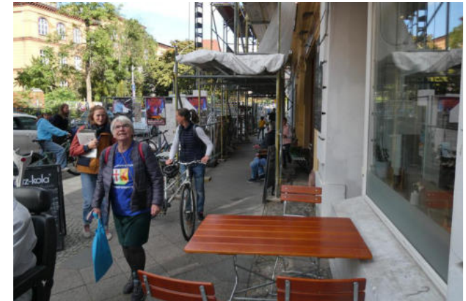
Was so alles im Weg stehen kann