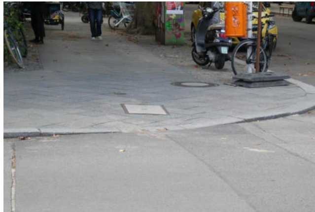
Absenkung ja - Erkennbarkeit für Sehbehinderte nein

Rollen vor Ort entdecken, wo sie sich barrierefrei bewegen können und wo nicht, an welchen öffentlichen Orten sie sich gerne aufhalten und welche sie lieber meiden. Die Teilnehmenden sind eingeladen, Ideen für gute Wege zum Zufußgehen festzuhalten.