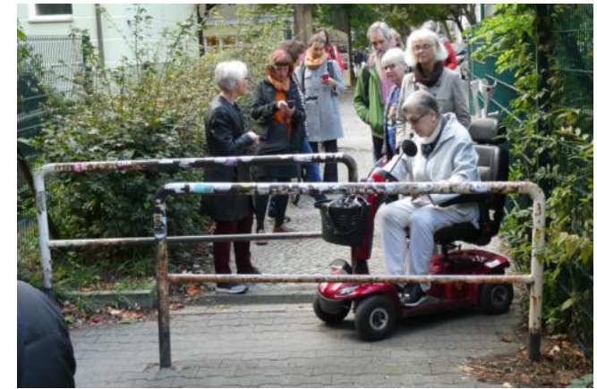
Dieser Mißstand ist mittlerweile entschärft

Veranstalterin ist die Bezirksgruppe von FUSS e.V. unterstützt von der Senior:innenvertretung und der Mobilen Stadtteilarbeit der Kiezoase