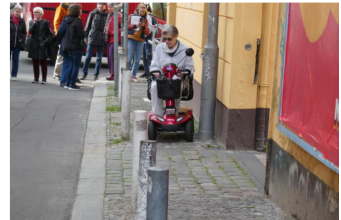
Kein Platz - aber selbst da versperren Poller den Weg